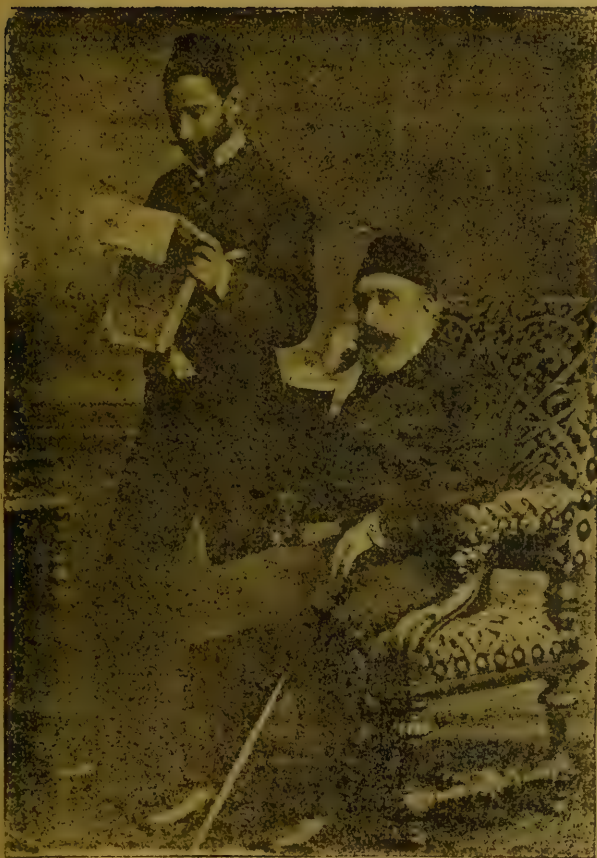
ابوالاحرار شهید حریت مدحت پاشا مرحوم [نفی واجلا ارلندی فی اوروپادہ کاتب خصوصاً سی ایبلہ برابر النمش فطوفرا فیدن] ۲۰ لیرا کی پارہلر حیقہ دینی روایت ایڈلیوری ایڈی ؟ عسکر